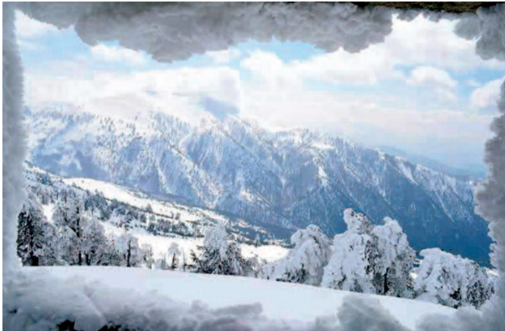
Το Βελούχι χιονισμένο

Μαζεύουνε λουλούδια όλοι δίνουνε και παίρνουνε φιλιά Δuo ονόματα σπουδαία Άνοιξη και Πασχαλιά.